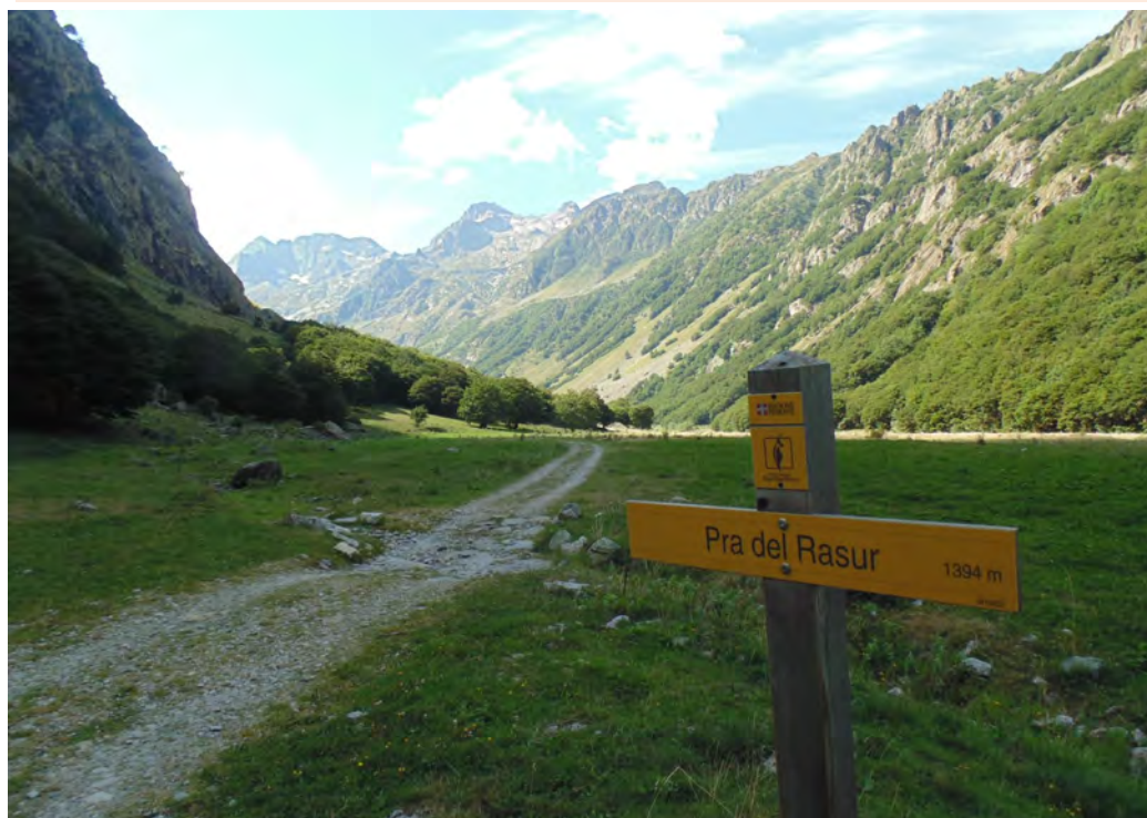
Pra del Rasur sulla strada che da San Giacomo di Entracque porta al lago del Vej del Buc.

più fratturabile e le fessure sono più numerose, il materiale di disfacimento, accumulato alla base delle pareti, è costituito da blocchi e pietre di minori dimensioni rispetto a quello dell'area cristallina, le conoidi sono ricoperte da zolle erbose e bassi cespugli. Si notano, sulle cenge in parete, piante pioniere che sono riuscite a colonizzare anche piccole aree, dove le radici pendono alla ricerca di humus e terriccio utilizzabili, mentre i rami si protendono verso la luce.