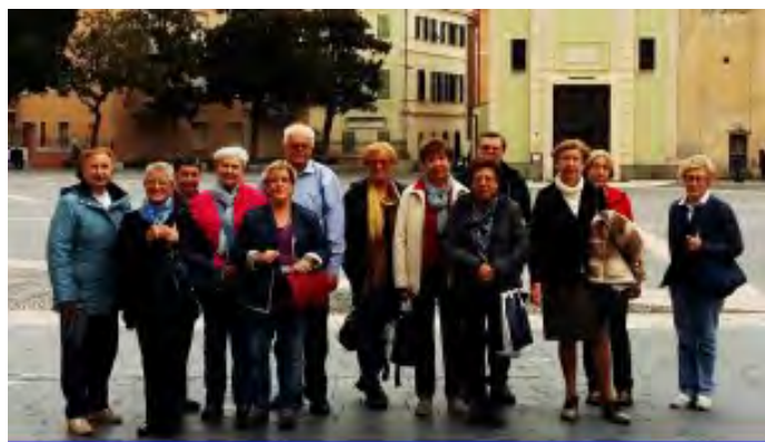
Il nostro gruppo (quasi al completo) a Loano il 26 ottobre 2016