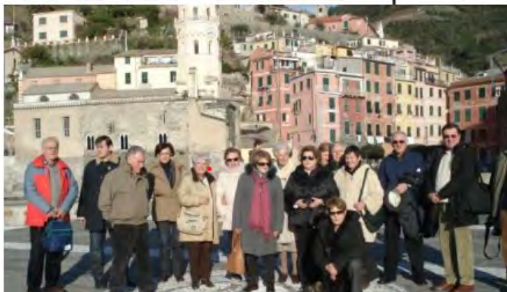
▲ Il nostro gruppo a Vernazza (Cinque Terre), l'11 marzo 2010