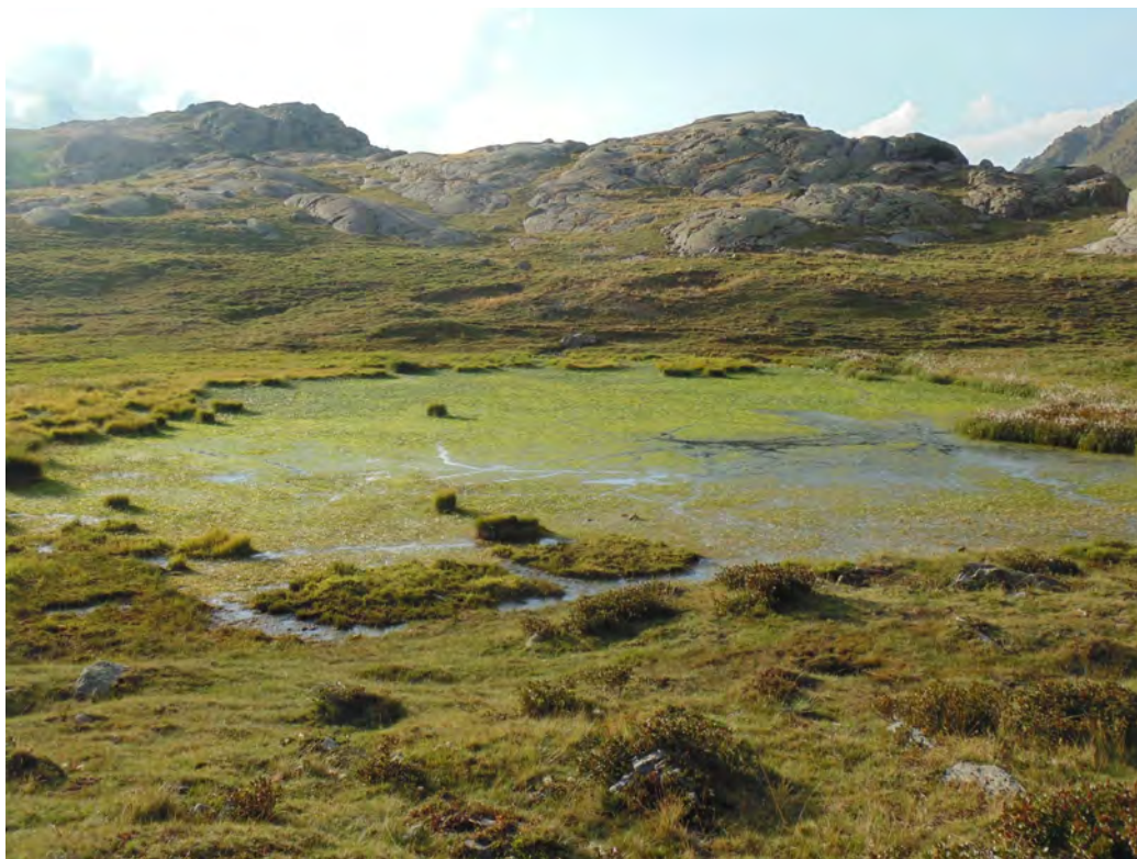
Un antico bacino lacustre ormai riempito da materiale eroso più a monte nella parte finale del Pra del Rasur.