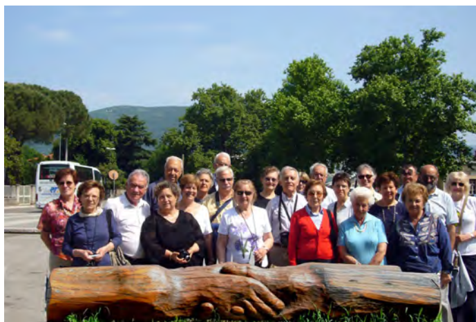
Gorizia/Nova Gorica, maggio 2009. Il gruppo di Imperia nella piazza su cui si affaccia la stazione della ferrovia transalpina, chiamata "Europa" al momento della caduta della frontiera (simbolo di amicizia le due mani che si stringono).

problema dello spopolamento in valle Argentina, L. Bagnoli su "Trasporti, toponomastica e paesaggio").